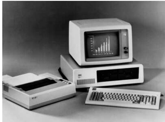
Bild 3. IBM Personal Computer, som kring mitten av 1980-talet kom att dominera marknaden.

Lite senare kom ABC 800. 6 I Mikrodatorn nummer 2 1981 skrev man: "Nu är den här, datorn som alla pratat om, men ingen har sett eller vetat så mycket om." Och det ser ut som om Luxor har lyckats att uppfylla dom förväntningar många hade på den nya datorn. Den kan fås med 40 eller 80 teckens skärm, den har färg och högupplösningsgrafik, 2 kilo ords BASIC är standard och många hjälprutiner finns, och den har en snygg design. Det är alltså ett stort steg framåt, men man ser ändå släktskapen.