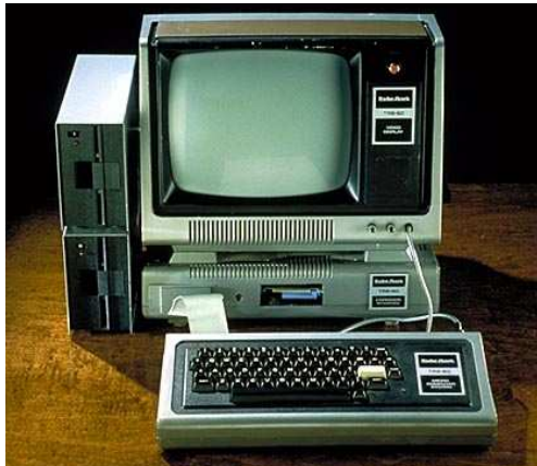
Bild 2. TRS-80, en av ABC 80's konkurrenter.