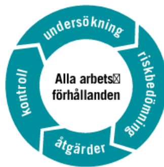
Figur 2: Visar en bild på att det systematiska arbetet är en evigt pågående process (Arbetsmiljöverket, 2024).

De centrala aktiviteterna i det systematiska arbetsmiljöarbetet kan åskådliggöras som ett hjul, det så kallade SAM-hjulet, för att arbetsgivaren kontinuerligt ska utföra arbetsmiljöundersökningar, bedöma risker, implementera nödvändiga åtgärder och därefter utvärdera effekterna av dessa åtgärder (AFS 2001:1). Arbetsmiljöarbetet är en kontinuerlig process och visas nedan enligt figur 2 (Arbetsmiljöverket, 2024).