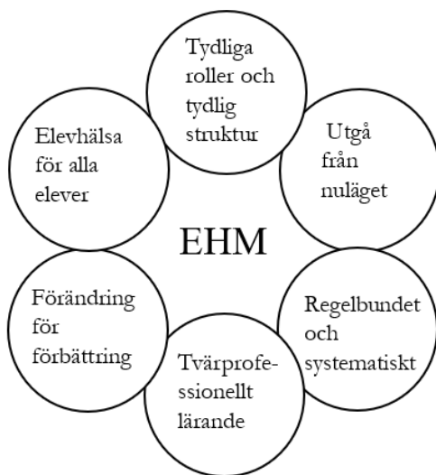
Figur 1. Figuren är inspirerad av Bengtsson et al., (2017) och beskriver grundpelarna i EHM.

Ett salutogent förhållningssätt kan ses som en grund i det främjande och förebyggande arbetet och utgör därmed grunden i elevhälsomöten EHM (Bengtsson et al., 2017). EHM är