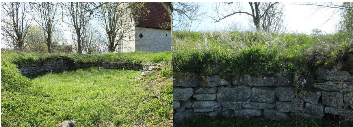
Figur 9 Vänster: Överblick över Västergarn kastal Höger:

Utgrävningar från Västergarn visar att flera indikationer på en handelsverksamhet, detta syns tydligast i keramiken som uppvisar relationer med Novgorod i dagens Ryssland (Holmbäck 2017:73). Flera utgrävningar utförda av Högskolan på Gotland (numera Uppsala Universitet Campus Gotland) visar att på flera bostadshus från tidig medeltid (Eriksson 2016:8ff).