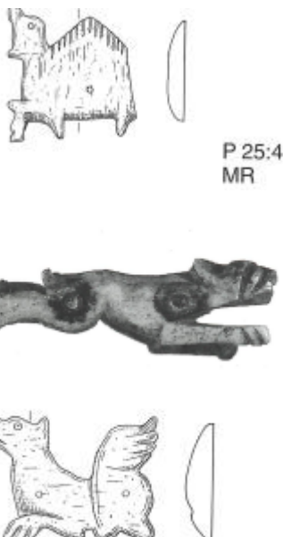
Figur 13: Längst upp: Ben /horn beslag föreställande en dromedar ,funnen i Eketorp III

Den utgrävning av kastaler som genererat mest material är utgrävningen av Hamra kastal. Bland fynden finns bland annat armborstpil, djurhuvudformat spänne, beslag av horn /ben (se Figur 14 pil), lins av bergkristall, radbandspärlor med mera. Ett av fynden skiljer sig från de övriga, nämligen beslag i horn. Detta är något som på Gotland, så vitt skribenten vet, endast har hittats i Hamra och i Visby. Flera liknande beslag har dock hittats i Eketorp III på Öland. I boken Eketorp III -Den