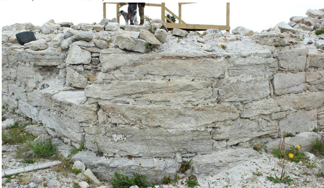
Figur 7: De avrundade hörnen på Hamra kastal notera likheten med biskopsborgen Kuressaare ovan till höger