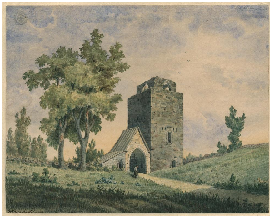
Figur 1: Tavla av PA Säve 1855 föreställande Gothem kastal