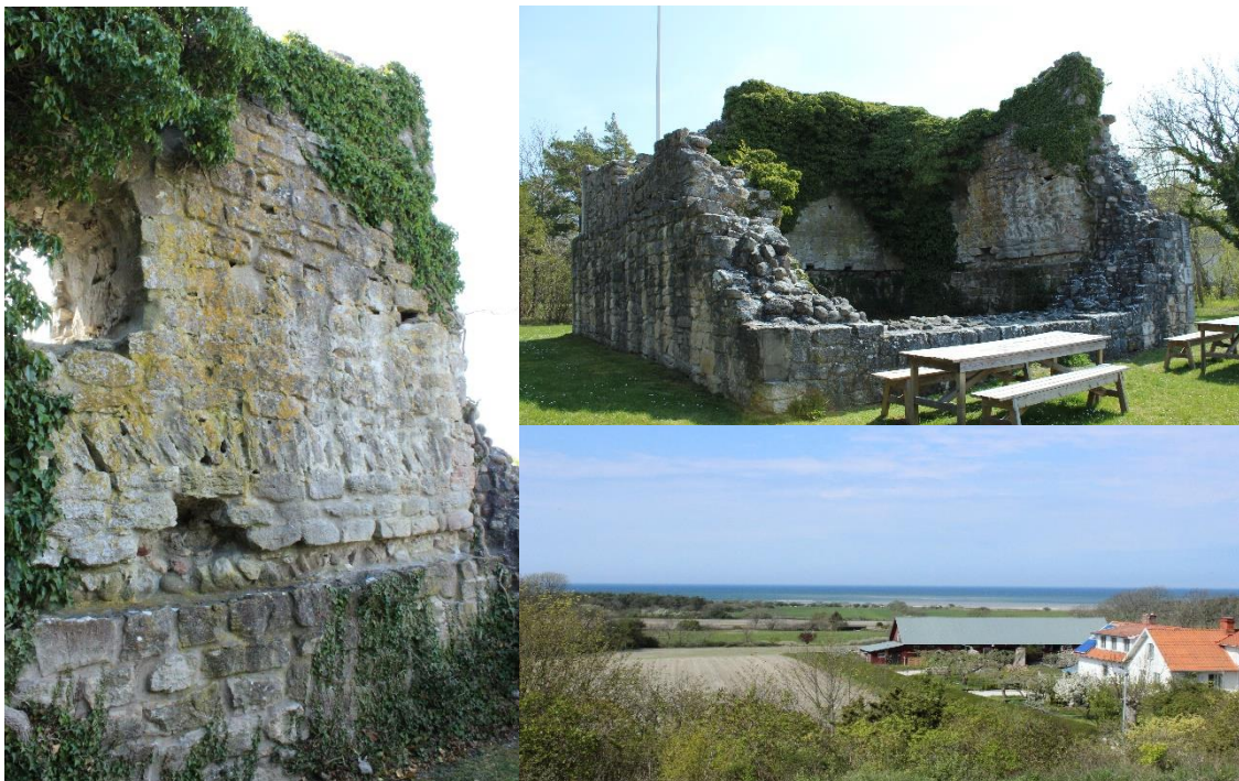
Figur 2: Till vänster: murinskränningar som visar olika våningar sedd från norr Höger upp: Fröjel kastal sedd från väst Höger ner: Nuvarande utsikt från Fröjel kastal