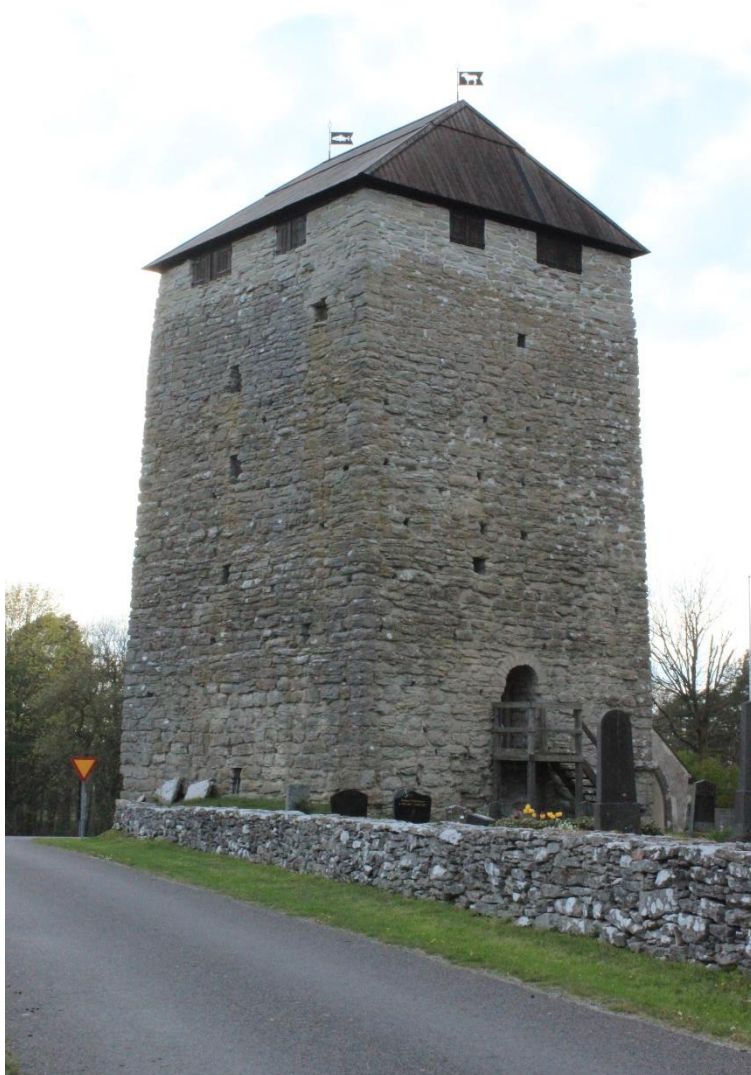
Figur 3: Gammelgarn kastal med en sentida kyrkomur