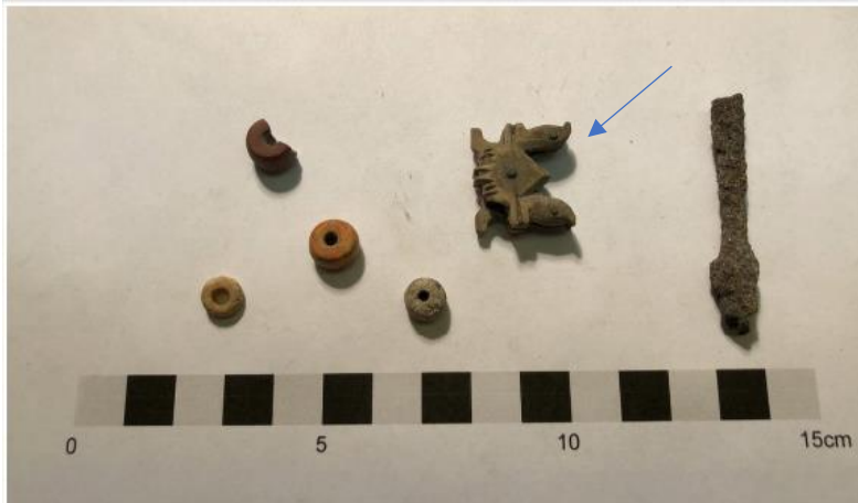
Figur 12: Beslag av horn/ben från Hamra Kastal