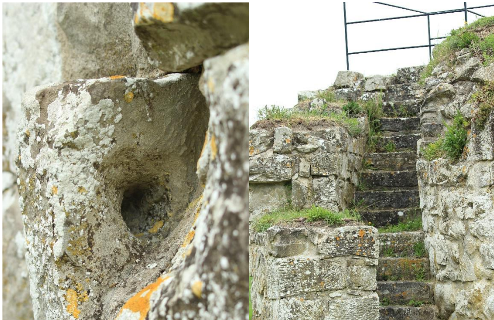
Figur 10: Vänster: Dörrhake i Öja kastal

1947 genomfördes en utgrävning av kastalen vilken utfördes av Gunnar Svahnström. Fynden som hittades var rödgoods, bronskedja, spik och bronsblek (Svahnström 1947:2). Inget av detta kan ge en säker datering och inte heller påvisa när kastalen byggdes (Svahnström 1942:60). Kastalen har dock en anmärkningsvärd detalj som inte återfinns hos de andra kastalerna på Gotland. Dess murtrappa finns längs med yttermurens västra sida. Trappan avsmalnar ju närmare ingången den kommer och smalnar till slut av in i tornet (se Figur 12 t.h). Skillnaden mellan denna trappa i Öja och den i Sundre kastal är att trappan i Öja sitter på kastalens utsida. Trappan smalnar inte av som i Sundre för att bära upp taket utan eventuellt snarare för att försvåra ett stort angrepp mot ingången. Trappan gör att kastalen inte blir helt rund i plan, utan snarare som en snäcka (Se figur 12 t.v) (Svahnström 1942:57). Göran Prahl menar att trappan i Öja kastal kan jämföras med en liknande trappa som Helfeling avtecknade i ett medeltida stenhus i Ronnarve (Gislestam 1994:155,157). Eftersom ingen liknande trappa återfinns hos de övriga kastalerna så tolkar Prahl trappan i huset antingen har influerats av kastalen eller tvärtom (Prahl 1996:12). Huset i Ronnarve finns tyvärr inte längre kvar (Qviström 1995:58).