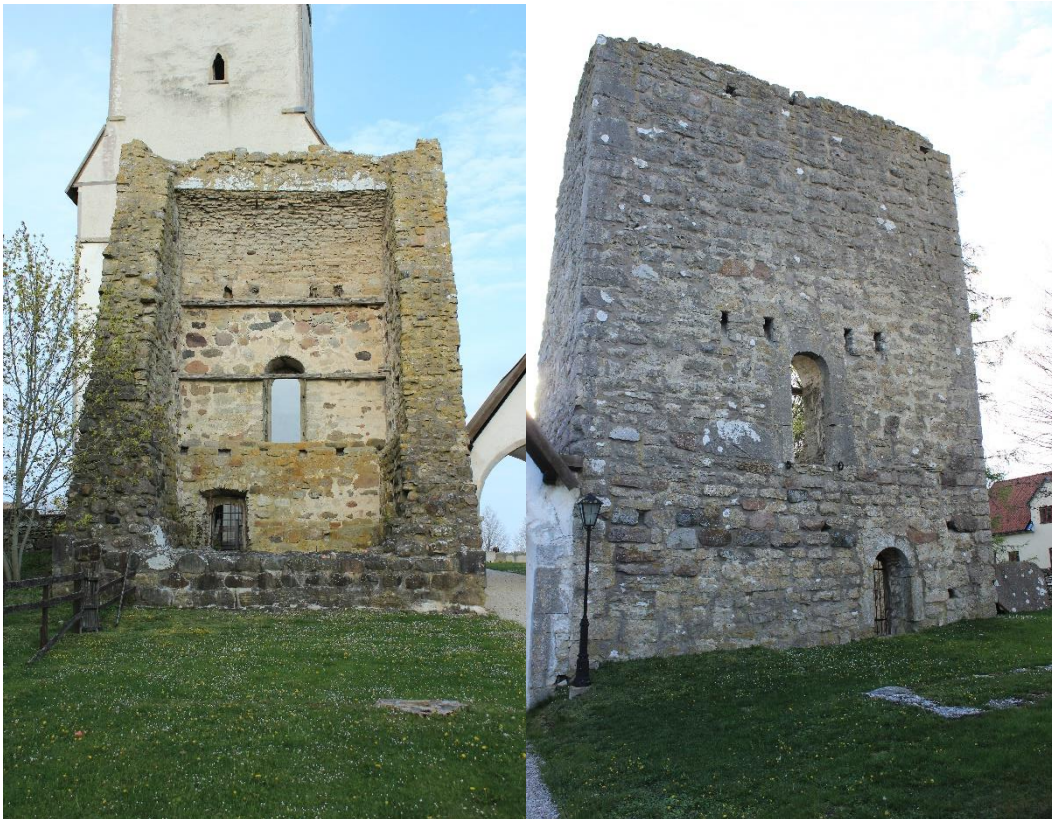
Figur 4: Gothem kastal sedd från väst (till väst)

Gothem kastal ligger tolv meter väster om kyrkan. Kastalen är i kvadratisk form och är 9x9 meter. Ruinen är cirka 13 meter hög men dess västra vägg är nästan helt förstörd, vilket hände någon gång på 1800-talet. (Säve bild). Den var dokumenterad men inte beskriven av Hilffeling. En tydlig beskrivning finns av C G Brunius från 1865. Hans tolkning var att kastalen hörde samman med en tidigare träkyrka. Anledningen till teorin att en tidigare träkyrka stått på platsen är att det nuvarande kyrktornet mycket väl skulle fungera som försvarstorn (Brunius 1865:247). Kastalen kan möjligtvis ha haft utsikt mot havet åt norr (Tidmark 1931:28). Idag finns endast den östra väggen kvar av kastalen på grund av ett ras 1867. Kastalen finns dock avbildad av PA Säve (se omslagsbild) och väl dokumenterad av C G Brunius som besökte kastalen 1865.