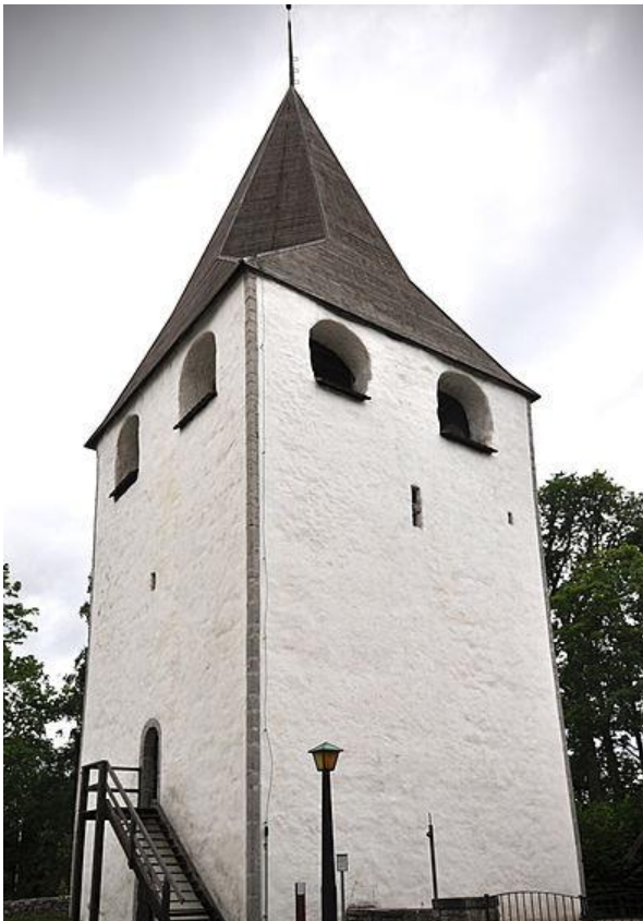
Figur 7: Lärbro kastal

Det går att följa, via Jöran Wallins anteckningar, att Kräklingbo kastal var bebodd av präster mellan åren 1630 – 1730 (Lithberg 1932:65-66). En ytterligare analys om prästbostaden sista tid finner vi i prästgårdsinventeringarna. Senast 1740 är det känt att kastalen inte längre tjänar som prästbostad. Prästgården går under åren 1680 till 1744 från sex till 3 rum. (Edle 1933:72). Även fast det i klarhet inte säger att det påverkar kastalen så finns en notis om att den 1763 står förfallen (Edle 1933:72). Troligtvis revs kastalen någon gång mellan 1763 och 1775. Eventuellt var detta en konsekvens av att Kräklingbo fick en ny präst 1772 (Edle 1933:73). Vissa källor