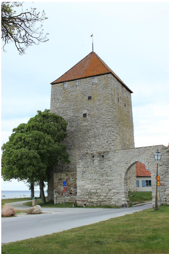
Figur 6: Kruttornet sett från Sydväst

Kruttornet, liksom i Søndre kastal, har troligtvis haft stegar mellan vissa våningsplan (Tidmark 1931:20). Kruttornet i Visby är också en av få kastaler som inte tydligt kan kopplas till en kyrka. Den närmsta intilliggande kyrkan är ST Olof som låg i nuvarande DBW:s botaniska trädgård.