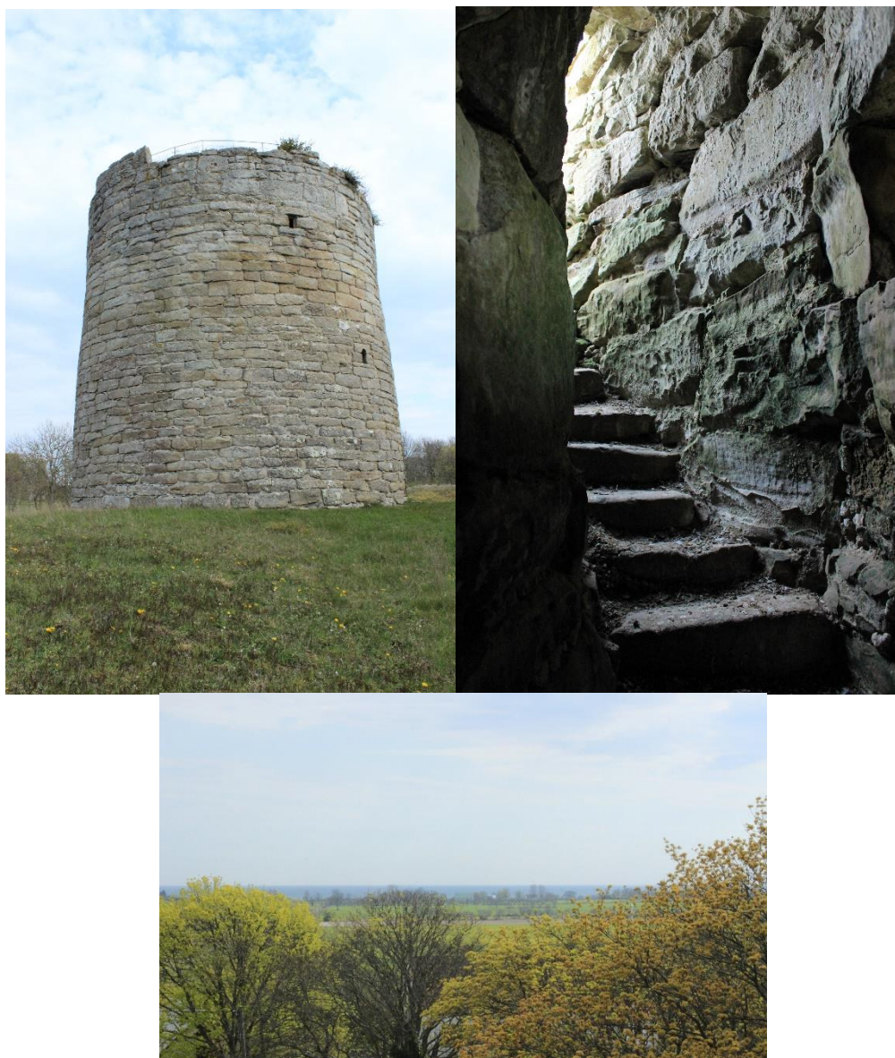
Figur 8: Vänster: Sunde kastal

övriga gotländska kastalerna. Kastalens andra och tredje våning har varit sammankopplade med stegar likt den tolkning som finns av Kruttornet. Detta argumenterar Tidmark för då avståndet mellan de båda våningarna ligger på tre meter. Dessutom finns det rester efter bjälkar som Tidmark tolkar som rester efter ett trägolv (Tidmark 1931: 9). Mellan tredje och fjärde våningen finns en trappa som endast är 0,5 meter bred. Trappan är byggd längs med väggen och har troligtvis varit så smal att det inte varit möjligt att mötas i den (se Figur 10 t h) (Tidmark 1931:10). Trappan är även byggd så den smalnar av ju högre upp i kastalen den kommer. Avsmalningen har av Tidmark tolkats vara av fortifikationsskäl för att kunna stärka muren som behöver klara av belastningen från taket. Taket har troligtvis varit platt. Tidmark tolkar detta som att kastalen har tjänat som vaktorn (Tidmark 1925:10). Detta är samstämmigt med Hilfelings observation att det från kastalen är fri sikt till havet åt öster, väster och söder (se Figur 10 centralt)(Hilfeling 1994:165).