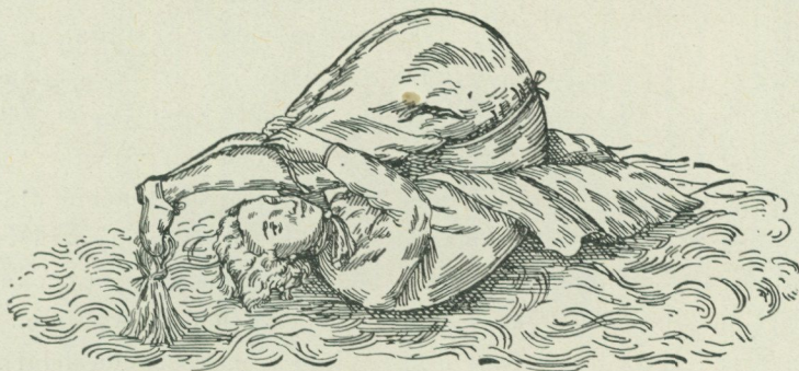
Fig. 2. »Ta jultuppen». Efter O. Rudbecks Atland. D. 2 s. 212.

jullek i en »Juhle-Wijsa För år 1772», och har för öfrigt in till senaste tid fortlefvat i de flesta landskap i vårt land. I Skåne (Albo härad) kallas leken »ta juldockan», i Småland och en del af Halland »ta julpyttan» (pytta = höna), 1 i andra orter af Halland och i delar af Västergötland »ta julbocken», i andra delar af sistnämnda landskap »ta jultuppen», »ta juletippan» (tippa = höna), i Bohuslän likaledes »ta juletyppan» eller »juletippan», i Dalsland »ta julekyppan», i Uppland »ta juletuppen» och i Jämtland »ta jultuppan». Leken är mig vidare, utan att jag vet den särskilda benämningen inom orten, känd