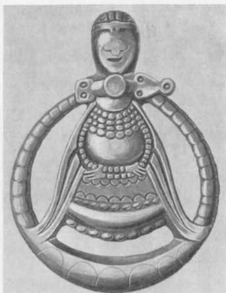
Fig. 2. Hängsmycket från Hagebyhöga efter teckning av B. Händel. 2/1. — Hängeschmuck von Hagebyhöga.

och de senare vikingatida, filigranprydda guld- och silverspän- nena 7 den kraftigt markerade kantbård, som utmärker det spänne, som avbildats på Tunakvinnan. Denna bård är emeller- tid utomordentligt karakteristisk för ryggknappspänneas runda mittknapp, där granatinläggningarna gå i en bård kring den mer eller mindre tornliknande mittknoppen, jfr fig. 4. Med all sannolikhet är således det smycke, som avbildas på kvinno- figuren från Tuna ett ryggknappspänne, vilket dock på grund av bildens profilställning endast återgivits med den stora mitt- knappen.