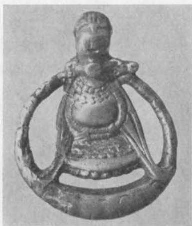
Fig. 1 a. Hängsmycke av förgyllt silver från Hagebyhöga, Aska socken, Östergötland. — Hängeschmuck aus vergoldetem Silber von Hagebyhöga.