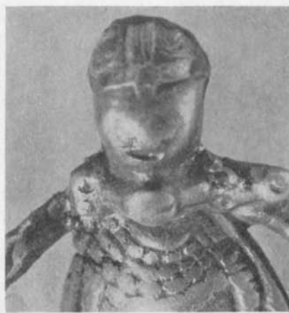
Fig. 1 b. Detalj visande ryggnappspännet på kvinnan från Hagebyhöga. — Detailbild der Rückenknopfsperre von dem Frauenbild von Hagebyhöga.

av samma slag. Man känner igen dräkten med den vida manteln och därunder en lång kjol, här med rutmönstrade bårder. På huvudet synes en ögleformig hårknut, framför vilken ses en sorts förhöjning, som möjligen återger en huvudbonad av det slag, som kvinnan från Hagebyhöga bär. Framtill på bröstet ses det fyr-radiga pärlsmycket, där pärlorna i den undre raden i likhet med motsvarande pärlor på bilden från Hagebyhöga äro något förstorade. Ovanför pärlsmycket sitter ett stort spänne, som här består av en rund knapp med tydligt markerad kantbård. Kantbården antyder att knappen ej bör tydas såsom ett runt spänne, utan torde motsvara ryggnappen på ett ryggnappspänne av den typ, som kvinnan från Hagebyhöga bär. Runda spännen äro nämligen en sällsynt och främmande föremålsform i uppsvensk miljö under yngre vendeltid, den epok till vilken kvinnan från Tuna bör dateras. De få runda spännen, som finnas, 5 sakna i likhet med de samtida gottländska, dosformiga spännena 6