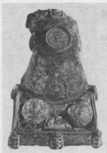
Fig. 13. Ryggknappspänne av förgyllt brons med inläggningar av granater som i ett fall ersatts med ett pånitat guldbleck. Observera även bågens indelning i tre distinkta fält. Havdhems socken, Gotland. 2/3. — Rückenknopfspange aus vergoldeter Bronze mit Einlagen aus Granatsteinen, die in einem Fall durch ein aufgenietetes Goldblech ersetzt sind.

översättning av ordet "antrax", den grekiska benämningen på denna ädelsten.