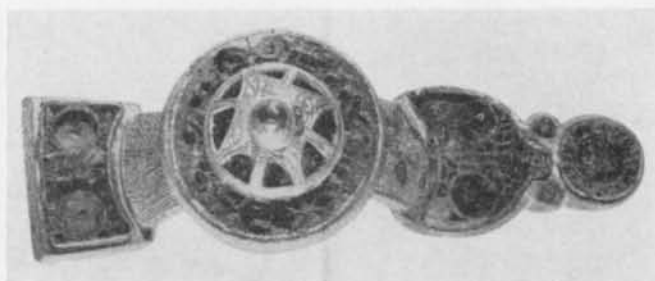
Fig. 4. Ryggknappspänne av förgylld brons med inläggningar i granatcloisonné från Ruda socken, Östergötland. 1/2. — Rückenknopfspange aus vergoldeter Bronze mit Einlagen in Granat-Cloisonné aus dem Ksp. Ruda.

endast äro antydda. På fig. 8 är nätt och jämnt knappen iakttagbar. Fig. 7 och fig. 10 visar en annan form av stilisering där ryggknappspännets tre delar blivit nästan jämnstora. I dessa två fall har denna detalj tidigare tolkats såsom ett pärlhalsband. 11 Om man jämför bilderna med fig. 6, förefaller det dock mera sannolikt, att man även i dessa fall avsett att avbilda ett ryggknappspänne. Med den kännedom vi har om pärlmodet under yngre vendeltid med fortsättning in i vikingatiden förefaller det över huvud taget osannolikt, att man burit pärlor i ett enkelradigt halsband synligt ovanför manteln på detta sätt. Under dessa epoker synes snarare det karakteristiska pärlsmycket bestått av en sammansatt flerradig pärluppsättning, avsedd främst såsom en heltäckande bröstprydnad. Detta framgår icke endast av samtida bildframställningar, jfr fig. 1—3, utan även av de iakttagelser man kunnat göra i fältet och av närmare analys av fynden, 12 där de obetydliga pärlspridarna, som från början kanske endast tjänat såsom lås i mer eller mindre kragliknande pärluppsättningar, nu bäres mitt fram såsom stora bröstprydnader. 13