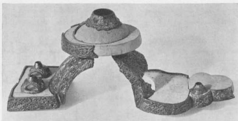
Fig. 11. Ryggknappspänne av brons från Kårsta, Roslagsbro socken, Uppland. 1/3. — Rückenknopfspange aus Bronze von Kårsta.

socken, Södermanland. 17 Fragment av ytterligare två dylika spännen finnas från gravfältet i Tuna, Alsike socken Uppland. 18 Även i Norge har man påträffat dylika jättespännen, varav ett är från Rogaland och två från Nordnorge. 19 Dessa överdimensionerade ryggknappspännen visa en vacker provkarta på den yngre vendeltidens stilar och äro enbart ur denna synpunkt värda en specialbehandling. 20