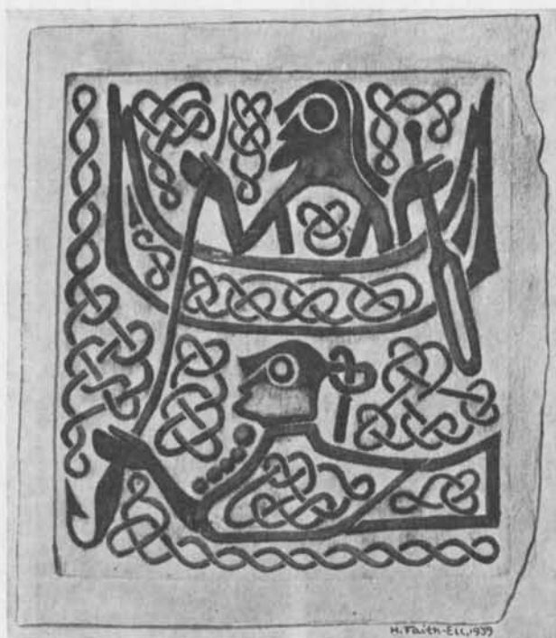
Fig. 5. Figurbleck av brons från Solberga socken, Östergötland. 3/1. — Figurenblech aus Bronze aus dem Ksp. Solberga.

stort ryggnappspänne kan fogas ett nyfunnet guldbleck förvarat i Eskilstuna museum. 14 Guldbblecket visar en figurframställning av samma slag som guldbblecken från Ekerö, och kvinnan bär ett stort spänne, i detta fall endast markerat med knappen.