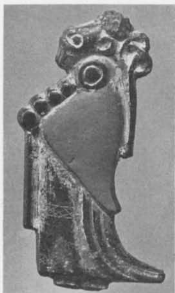
Fig. 3. Kvinnobild av förgyllt silver från Tuna, Alsike socken, Uppland. 2/1. — Frauenbild aus vergoldetem Silber von Tuna.

agerande personerna i en bildscen med för oss okänt innehåll. Hon är närmast framställd såsom en sjöjungfru, och kanske skall hon bringa fiskaren i båten en lyckosam fångst! Vi känner igen hennes smycken, underst det fyrradiga pärlsmycket och därovan ett spänne, som på denna stiliserade bild endast återgivits med en rund ring. Att smycket emellertid även i detta fall är ett ryggknappspänne, torde framgå av den nära överensstämmelsen med kvinnobilderna från Hagebyhöga och Tuna.