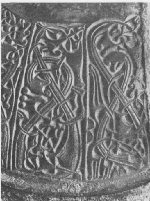
Fig. 12. Detalj från bågen till ryggnappspännet från Kårsta. — Detail vom Bogen der Rückenknopfsprange aus Kårsta.

Då dessa spännen en gång voro nya, ha de stora fälten, fyllda med granatcloisonné av sannolikt yppersta kvalitet, helt dominerat, och den djurornamentik, vi nu iakttaga, förträngd till spännets kanter och baksida, har spelat en obetydlig roll. Att sannolikt även granatcloisonnéen varit lagd i ornamentala mönster visa oss paralleller bland de mindre spännena, jfr fig. 4. De stora ryggnappspännena torde ha tillhört de praktfullaste granatsmycken, som överhuvudtaget funnits i Norden, i kvalitet väl jämförbara med på kontinenten förekommande, samtida granatinlagda reliksskrin. 21