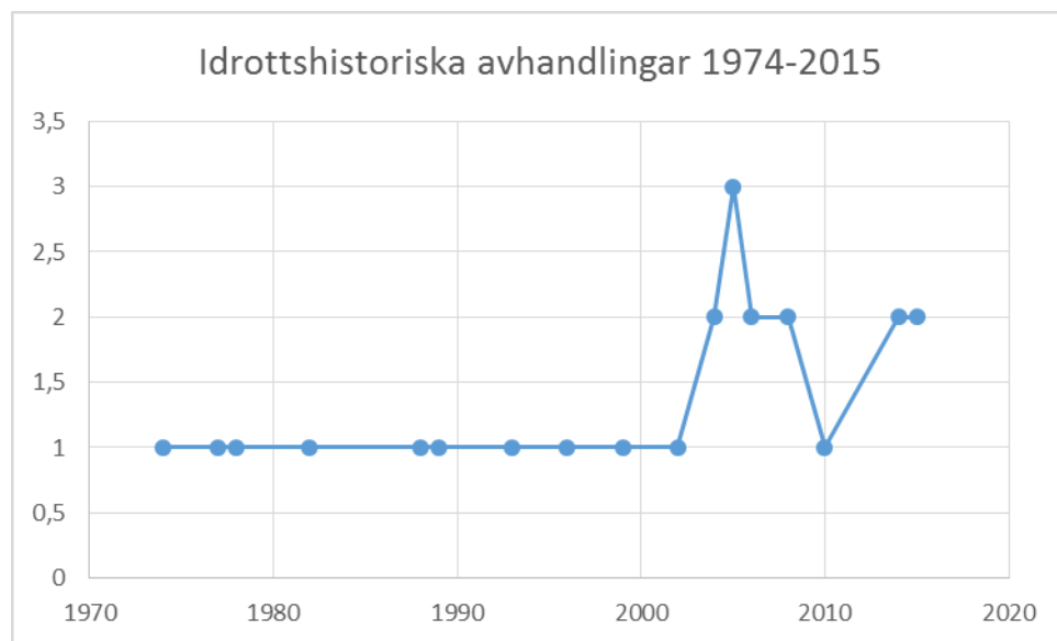
Diagram 1. Idrottshistoriska avhandlingar 1974 – 2015