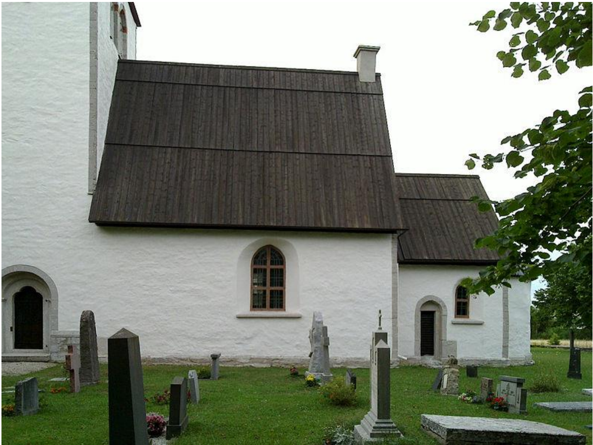
Figur 2. Akebäck kyrka. Tornet i väster, följt av långhus, kor och absiden i öster (längst till höger på bilden).