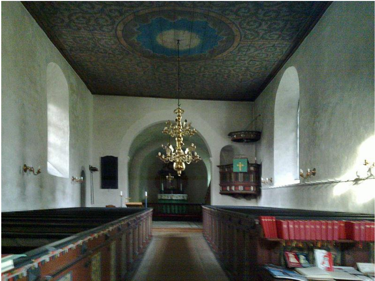
Figur 3. Akebäck kyrka interiör. Bild från långhuset i väster. Längst bort, i mitten av bilden, syns altaret i absiden.