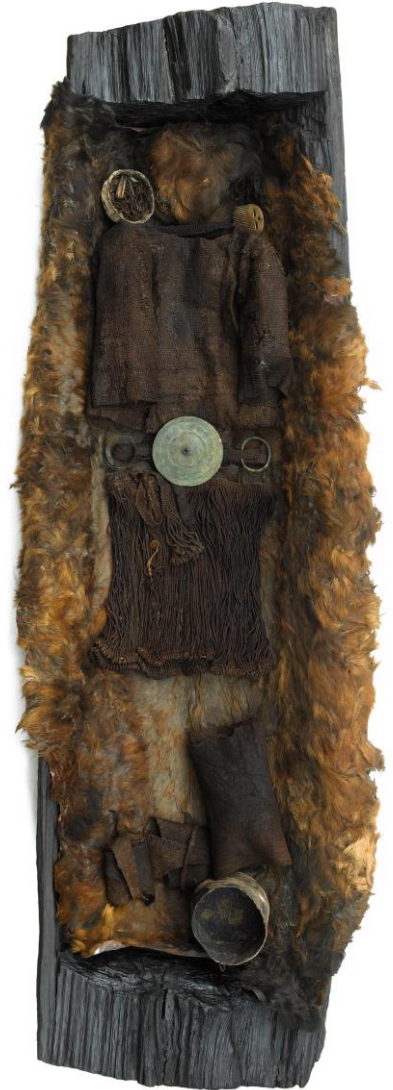
Figur 4. Egtvedpigen/Egtvedflickan

Att begrava en vuxen individ och ett barn tillsammans på detta vis är inte normen, men det finns andra exempel på danska gravar där ett barn har kremerats, precis som i fallet med Egtved. Paret har aldrig beskrivits som mor och barn.