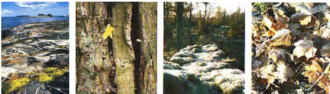
Fig. 117, 118, 119, 120. Sötvatten – en bristvara i Arkösund.

Sötvatten har alltid varit en central fråga på Vikbolandet. Arkösund och östra Vikbolandet är ett mycket regnfattigt område. Friskt vatten har därför alltid varit en värdefull bristvara, särskilt på sommaren då åtgången på vatten ökar. Förutom ökad åtgång på vatten riskerar försommartorkan att få många brunnar att sina, och invid havet finns risken för intrång av bräckt vatten. 316