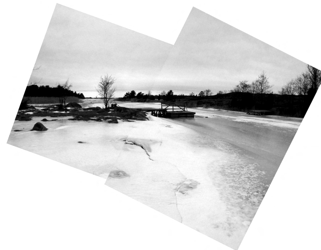
Fig. 113. Arkösund i vinterskrud.