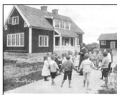
Fig.101. Arkösunds första skola med lärarbostad på övervåningen.