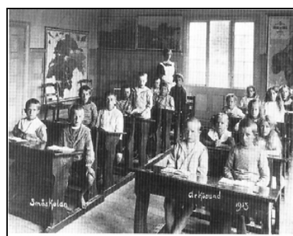
Fig.100. Småskolan i Arkösund år 1915.