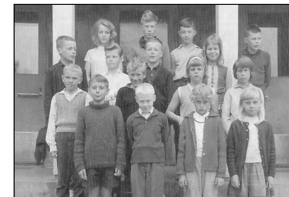
Fig.104. Skolfotografi från 1964, samma år som Arkösunds skola lades ner.