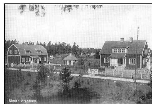
Fig.102. Folkskolan, byggd 1923 och lärarbostaden.

I övre våningen av skolan bodde då en lokförarfamilj, i den nedre ordnade man med skolsal, kapprum och bostad för lärarinnan 296 .