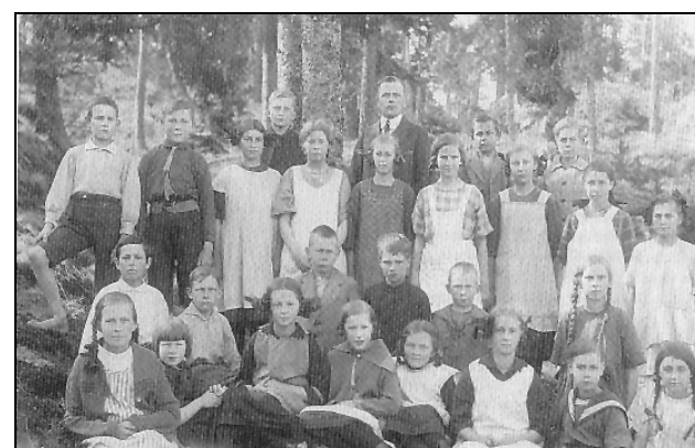
Fig.103. Skolfotografi från 1923. Arkösundsskolans första klass.