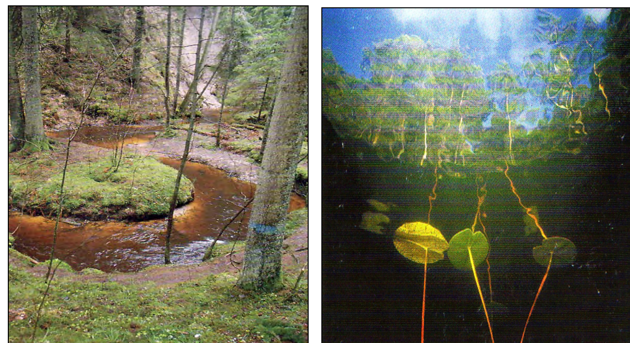
Fig. 121, 122. Det kommunala initiativet att förse Arkösund med vatten från sjön Mönnerum har i hög utsträckning underlättat levnadsvillkoren för arkösundsborna.

Under högsommaren, då det går åt mycket vatten, tas numera även vatten från Mönnerum uppe på Vikbolandet. Vattenförsörjningen därifrån var en stor och viktig kommunal satsning som tillät Arkösund att utvecklas som samhälle. 324