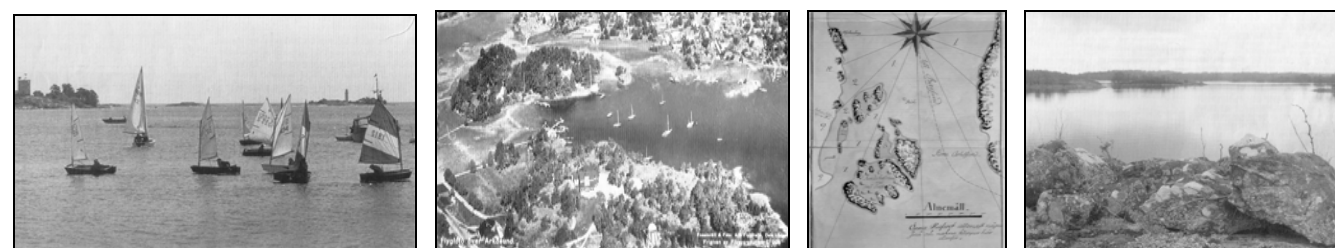
Fig.105, 106, 107, 108. Det är genom sina många segelregattor som Arkösund har rönt intresse hos allmänheten.

Samma år som Norrköpings Segelsällskap stiftades, 1887, föreslog inspektör C.V. Luthander att förlägga NSS båthamn till Arkösund. Förslaget avböjdes dock av ekonomiska skäl. 300