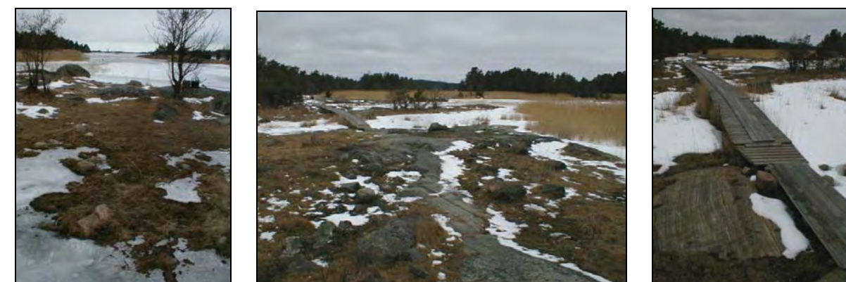
Fig. 114, 115, 116. Arkösunds skärgårdslandskap erbjuder, under såväl sommar- som vintertid, besökaren på storträdda naturupplevelser.