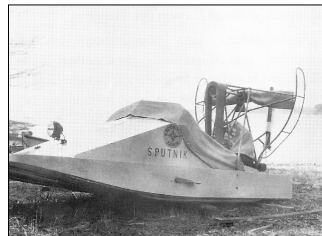
Fig. 98. Första hydrokoptern från Hästö.

Verksamheten har hela tiden hållits i liten skala och sammanlagt har inte fler än 260 Arkösunds-hydrokoptrar tillverkats. 293