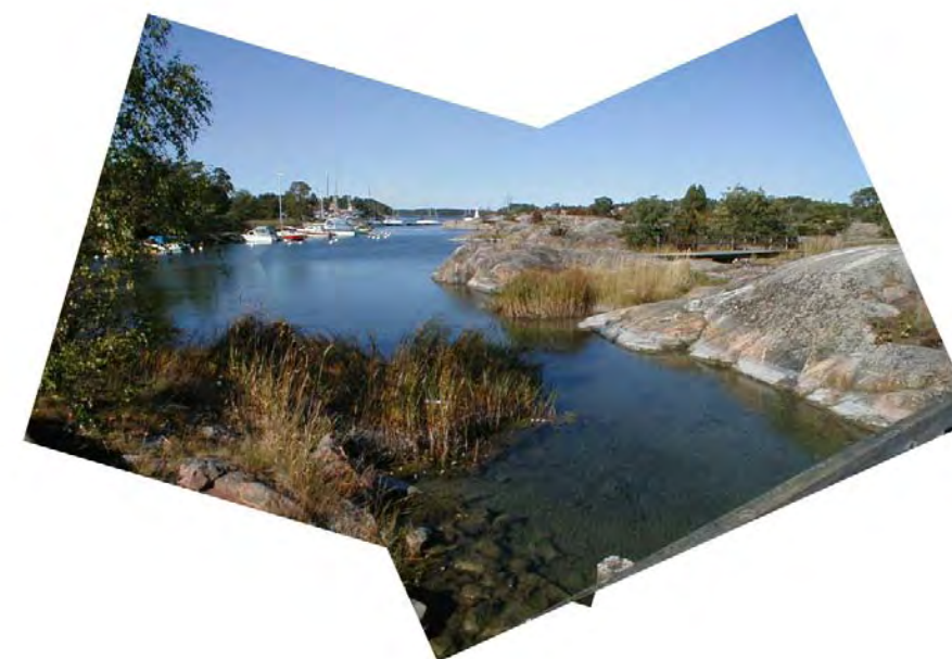
Fig.109. Skärgården – Arkösunds största resurs.

Skärgården sätter på flera vis sin prägel på livet i Arkösund och brukar vanligen delas in i följande tre zoner; närmast fastlandet ligger innerskärgården med stora öar, som Arkö och Gränsö. Här finns både rester av lövrika odlingslandskap och större barrskogsområden. Utanför ligger mellanskärgården med lite mindre öar där hällmarkstallskogarna dominerar. Exempel på detta är Korsö, Skallö och Törnholmarna. I ytterskärgården har öarna ganska nyligen stigit ur havet. De låga kalkkären har inte hunnit få någon trädvegetation, men markfloran är rik, särskilt om den gödslats med näring från fåglar. 309