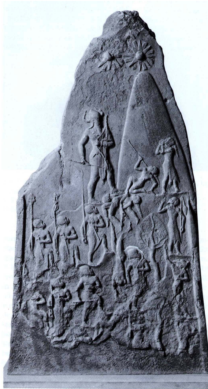
Bild 1. Naram-Sins segerstele 195