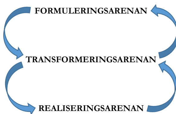
Figur 1: Läroplanens arenor.

De tre arenorna kan illustreras på följande sätt (egen tolkning och illustration):