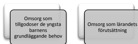
Figur 1. Utfallsrummet, Förskollärarnas uppfattningar av omsorgens roll i arbetet med yngsta barnen i förskolan.

Figur 1. Nedan visas en schematisk bild av studiens utfallsrum, dvs. studiens kondenserade resultat i vilket förskollärarnas uppfattningar av omsorgens roll i arbetet med de yngsta barnen framträder.