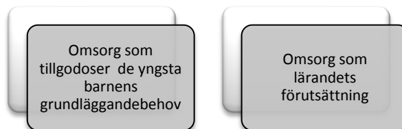
Figur 3 Studiens utfallsrum.

I studiens utfallsrum kommer resultatet att diskuteras och reflekteras i relation till tidigare forskning, teori och studiens frågeställningar. Studien avslutas med pedagogiska implikationer och förslag gällande vidare forskning inom området.