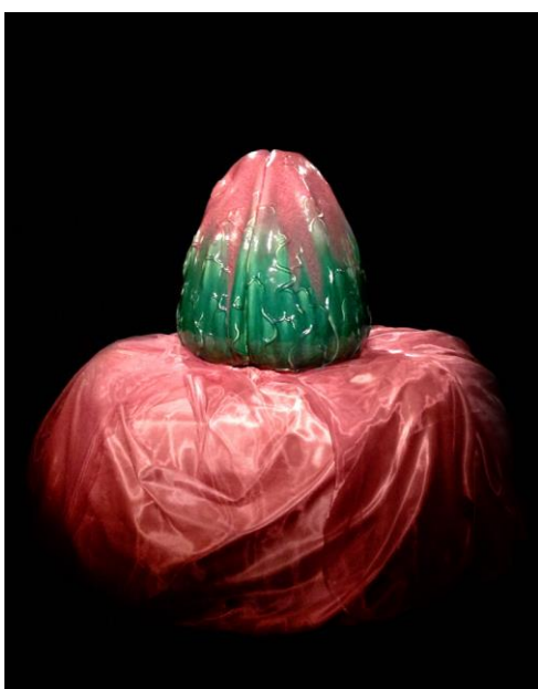
Gestaltning under examination 18/4-13

Det har varit ett mycket utvecklande och roligt arbete för mig. Jag känner mig säkrare i mitt utövande, både gestaltningsmässigt, vilka frågor jag vill väcka och hur jag väcker dem. Jag vill gärna se mitt konstnärliga arbete som en typ av kommunikation och det vill jag fortsätta att utveckla och förfina.