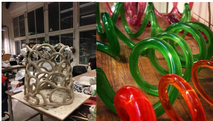
Tjejerna i Gustavsberg