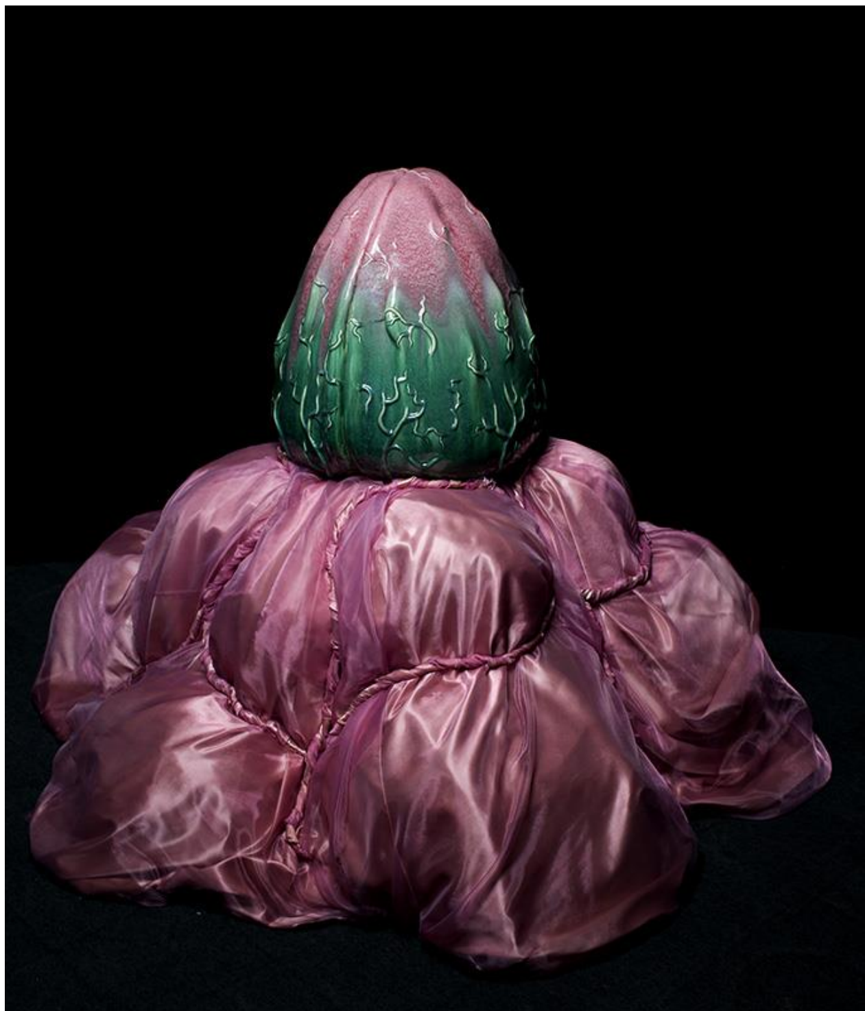
"Duktig Flicka" Vårutställning, Konstfack 2013