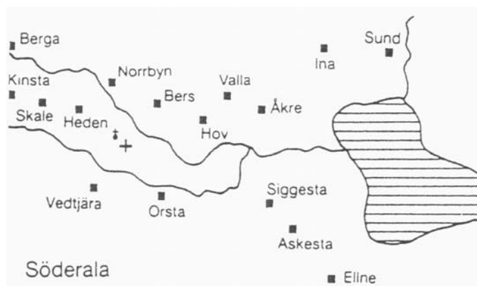
Karta från Brink, 1990, s. 356