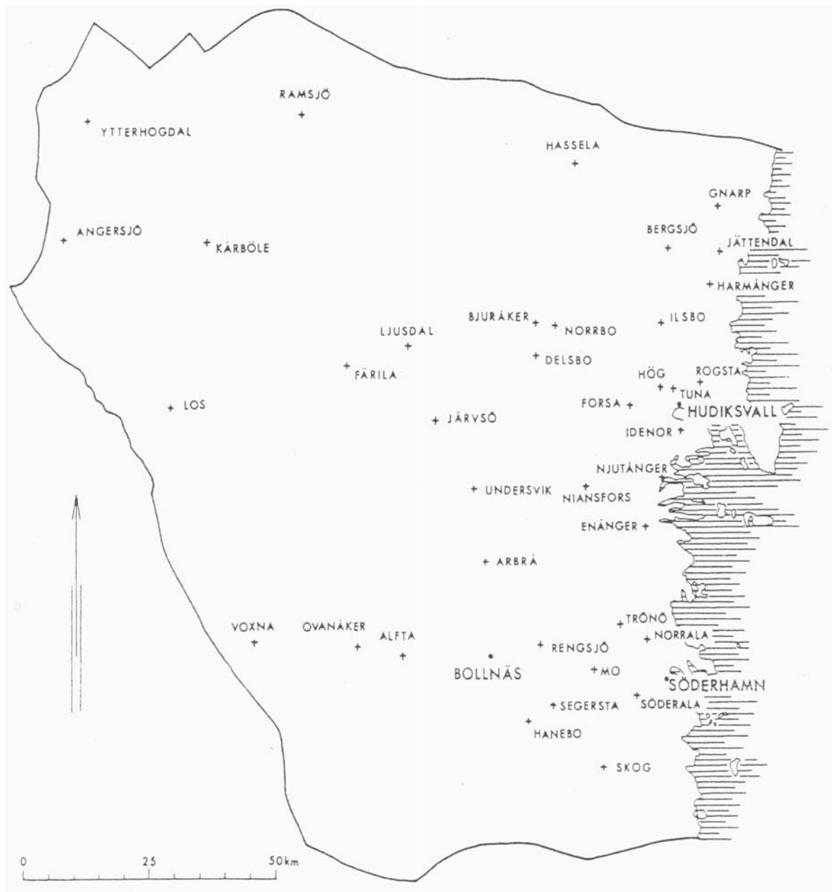
Karta från Brink, 1984.

Hälsingland är ett landskap i Norrland som i söder gränsar till Gästrikland, i väster till Dalarna och Härjedalen och i norr till Medelpad. Landskapet omfattar i dag 14264 kvadratkilometer och befolkningen uppgår till 143 781 invånare enligt 1990 års befolkningsciffror. Landskapets största del hör till Gävleborgs län men även Ytterhogdals och Ängersjö församlingar som hör till Jämtlands län samt en mindre del av Attmars församling som i övrigt tillhör Medelpad räknas till Hälsingland.