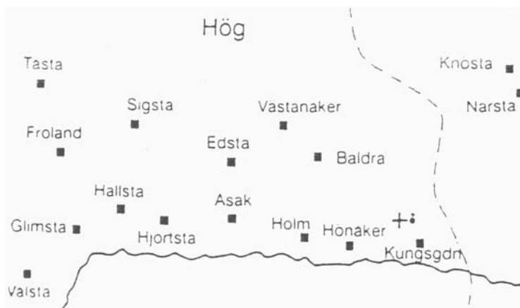
Karta från Brink, 1990 s. 357.