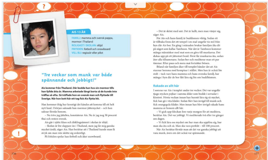
Bild tagen ur läromedlet Grundbok religion (Abrahamsson, 2011:156-157)

Det finns även ett stycke med rubriken ”Att leva som...” i samtliga kapitel om de fem världsreligionerna. Styckena presenterar fakta om hur det är att leva inom respektive religion, precis som rubriken säger. Texten i styckena är skrivna i ett ovanifrån perspektiv vilket gör att alla elever i klassrummet har möjlighet att förstå hur man lever inom olika religioner (Abrahamsson, 2011:50, 102, 120, 138, 152).