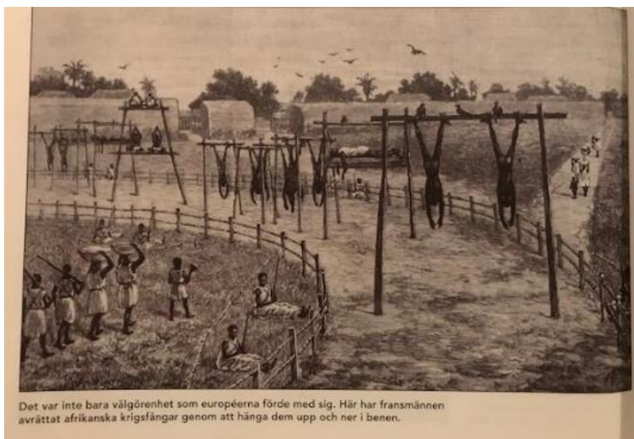
Figur 3: Ur boken Historia Punkt SO (2001)