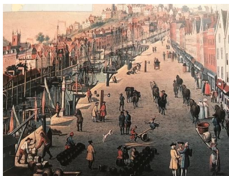
Figur 2: Ur boken Historia 2 (1996)