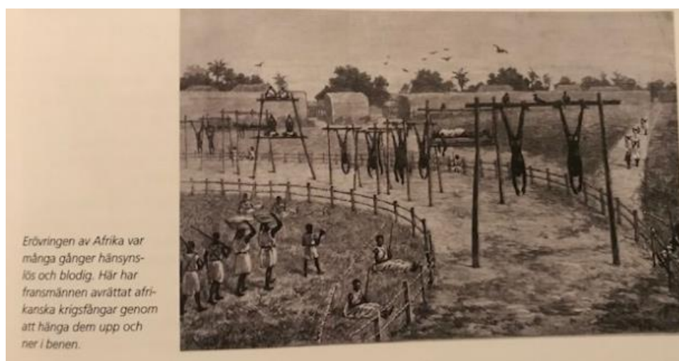
Figur 4: Ur boken Historia 7–9 Utikik (2013)

Hur kan denna förändring förstås? Enligt min tolkning kan jag konstatera att det finns en liten förändring i hur Afrika och afrikaner beskrivs i de olika läroböckerna över tid. Denna förändring kan förstås på två olika sätt, det första är att begrepp som förminskar har bytts ut och att det finns en tydligare beskrivning på de grymheter som utövades på afrikaner. Den andra är att Afrikas förkoloniala historia har krympt avsevärt. Således är förändringen både positivt och negativt. Dock är den positiva förändringen inte tillräckligt stort, då det fortfarande finns en tydlig etnocentrism även i de nyare böckerna. Att förändringen är så lite