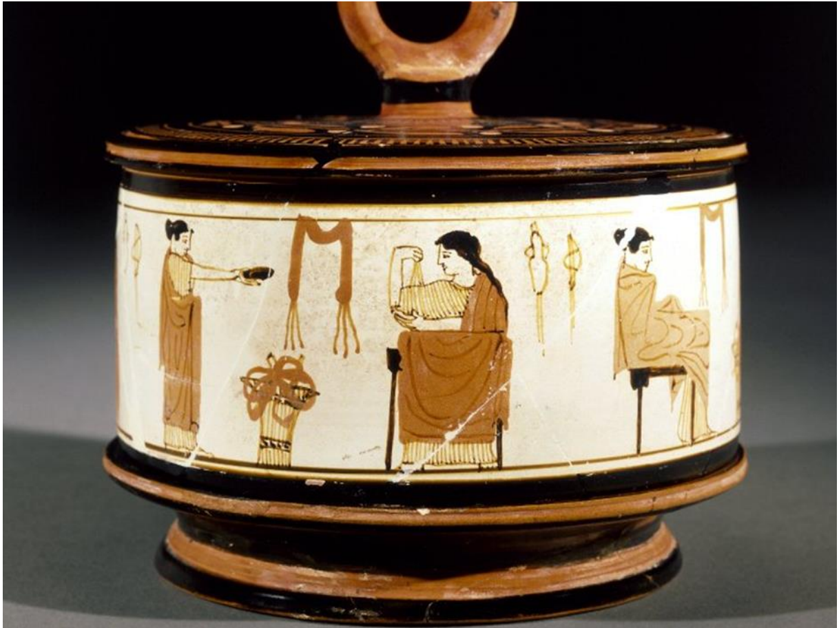
Fig. 1 Kvinnor utför hushållsarbete, spinnerskor. Pyxis med vit bakgrund, ca 460–450 f.Kr. Attika.