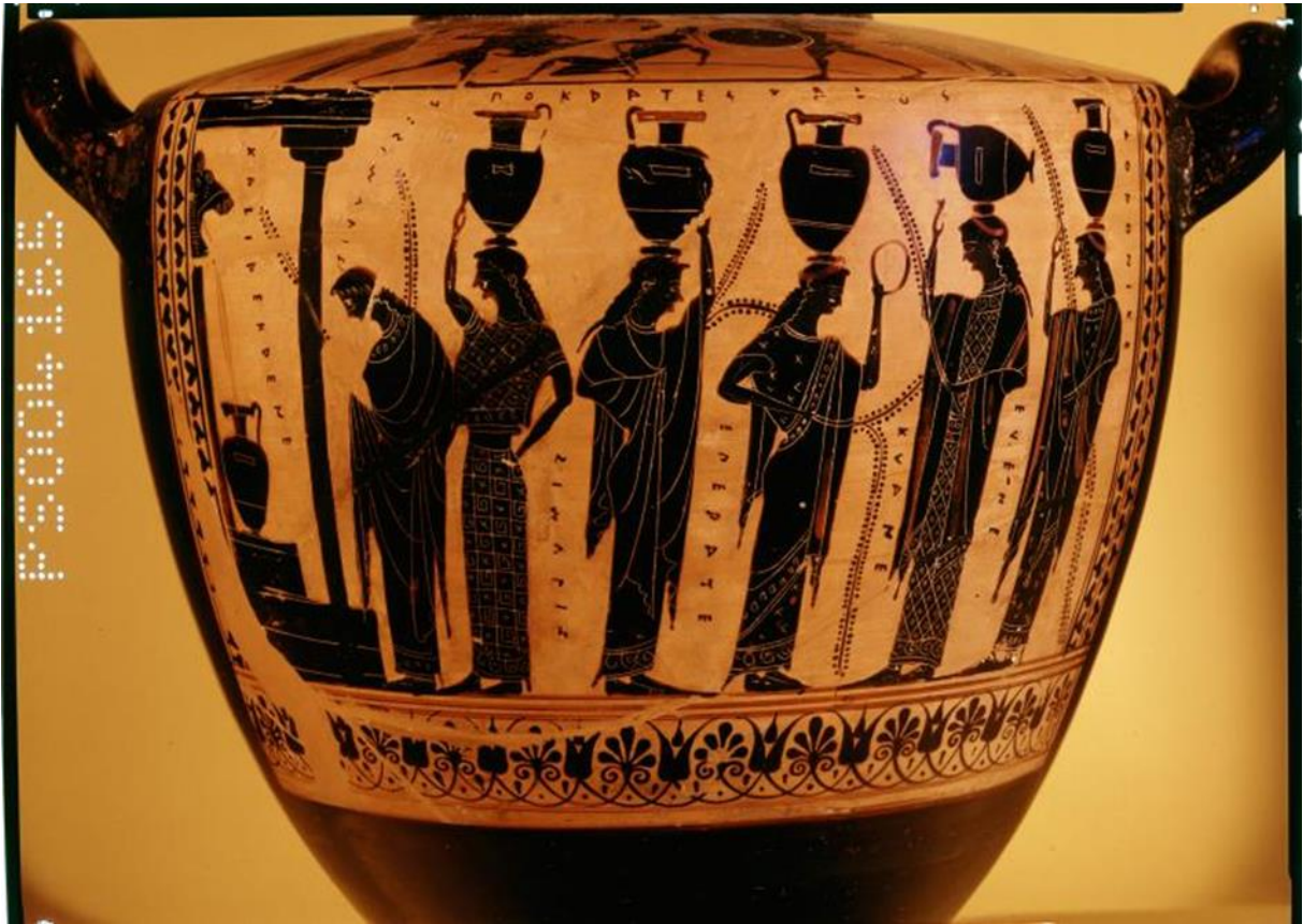
Fig. 2 Kvinnor hämtar vatten från stadens offentliga fontän. Svart-figurlig hydria, ca 510 f.Kr. Attika.