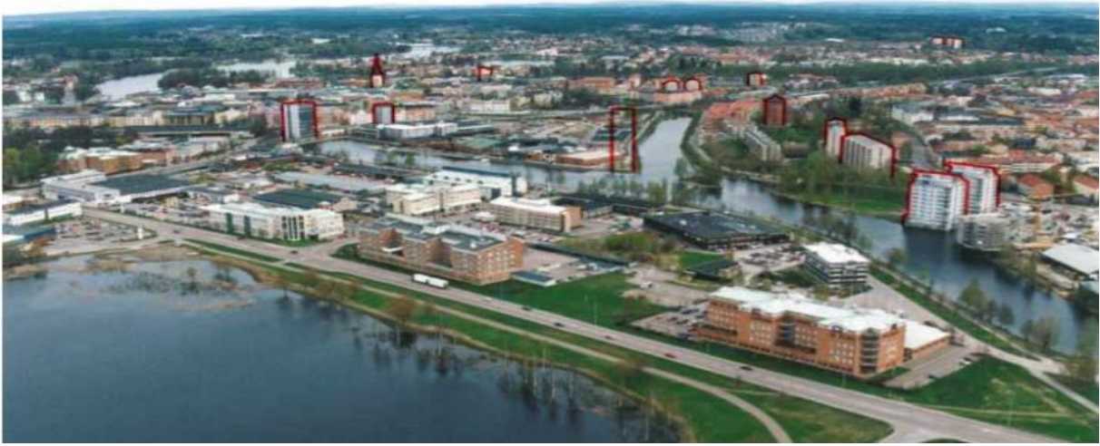
BILAGA 2 (OLMÅRS 2007:7)